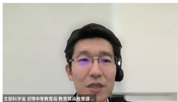
大根田教員免許・研修企画室長